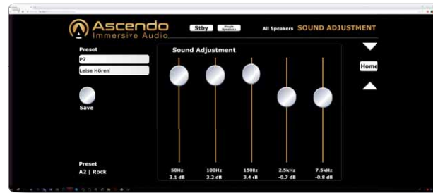
Alle Presets können nach Belieben benannt werden: Hier im Beispiel „Leise hören“ mit angehobenen Bässen und etwas betontem Präsenzbereich

stimmung malen sie ein wunderbar raumgreifendes und plastisches Klangbild, mit allerbesten Fokussierung und exzellenter Durchhörbarkeit. Das funktioniert sehr leise bis sehr laut in bewundernswerter Deutlichkeit und höchster Präzision. Es ist schon erstaunlich, was den doch recht zierlichen Standlautsprechern an Dynamik und Basspotenz innewohnt. Es mag zwar die allerunterste Oktave fehlen, doch was es an „echtem“ Bass gibt, stellt auch den anspruchsvollsten Hörer zufrieden. E-Bass, Schlagzeug und synthetisch generierte Sounds stellen die D6 Active mit Nachdruck in den Raum. Uns gefällt die enorm gute Auflösung in den mittleren und hohen Tonlagen – an Details gibt es kein Mangel. Dabei bleiben die Lautsprecher sehr harmonisch und nerven nie mit übertriebener Härte oder einem Übermaß an Analytik.