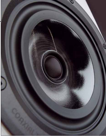
Im Zentrum der paarweise selektierten Chassis sitzen Gewebekalotten. Auffällig ist die inverse Sicke, die das Abstrahlverhalten optimiert

stimmung malen sie ein wunderbar raumgreifendes und plastisches Klangbild, mit allerbesten Fokussierung und exzellenter Durchhörbarkeit. Das funktioniert sehr leise bis sehr laut in bewundernswerter Deutlichkeit und höchster Präzision. Es ist schon erstaunlich, was den doch recht zierlichen Standlautsprechern an Dynamik und Basspotenz innewohnt. Es mag zwar die allerunterste Oktave fehlen, doch was es an „echtem“ Bass gibt, stellt auch den anspruchsvollsten Hörer zufrieden. E-Bass, Schlagzeug und synthetisch generierte Sounds stellen die D6 Active mit Nachdruck in den Raum. Uns gefällt die enorm gute Auflösung in den mittleren und hohen Tonlagen – an Details gibt es kein Mangel. Dabei bleiben die Lautsprecher sehr harmonisch und nerven nie mit übertriebener Härte oder einem Übermaß an Analytik.