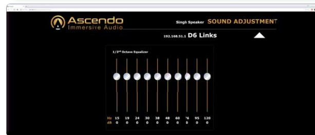
Hier im Bild ist der 1/3-Oktav-Equalizer für die Einstellung der tiefen Frequenzen von 15 bis 120 Hertz zu sehen. Jeder Lautsprecher kann einzeln korrigiert werden

Alles spielt aus einem Guss, das funktioniert bei Dillons brüchiger Stimme und sparsamer Instrumentierung genauso gut wie bei Agnes Obels feinem Gesang oder aufwendig produzierten Rockstücken, wie die von uns gehörten Titel von Puscifer und A Perfect Circle. Das Schöne dabei ist, dass der Zauber der Musik erhalten bleibt, egal ob wir vom guten, alten Vinyl oder unserem NAS zuspielden.