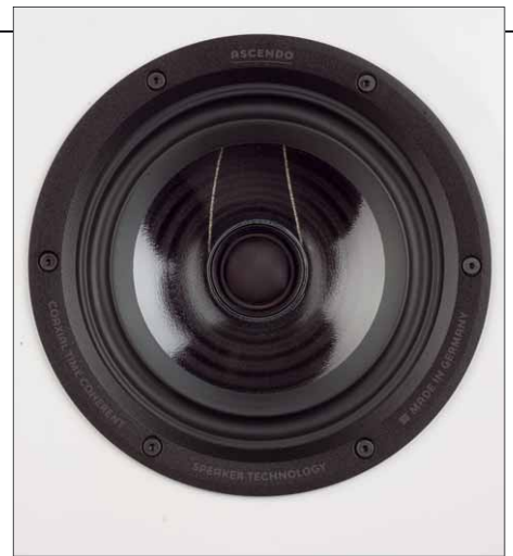
Transparent: Die Konusmembran des Koaxialtreibers ist durchsichtig, was für eine reizvolle Optik sorgt

Abstrahlverhalten des Lautsprechers, mit nahezu deckungsgleichen Amplituden unter 0, 15 und 30 Grad. Nur bei 10 Kilohertz ist auf Achse eine kleine Auslöschung durch die koaxiale Bauweise zu erkennen. Auch das Klirrvverhalten ist großartig, ja geradezu souverän für einen Treiber dieser Größe. Selbst bei lauten 95 dB bleibt der kritische K 3 -Wert im relevanten Bereich immer deutlich unter einem Prozent. Erst unterhalb von 150 Hertz übersteigt der K 3 -Wert die 1%-Marke.