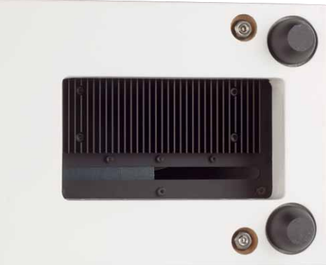
Durch den Ausschnitt im Sockel kann das Verstärkermodul Frischluft schnappen. So ist die ausreichende Kühlung des Schaltverstärkers sichergestellt

Die schlanke Aktivbox zeigt im Messlabor ein ganz vorzügliches Verhalten bei hohen Pegeln. Obwohl 95 Dezibel anliegen, bleiben die K 2 - und K 3 -Klirrwerte immer deutlich unter der 1-Prozent-Marke. Erst unterhalb von 200 Hertz steigt der Klirr naturgemäß an