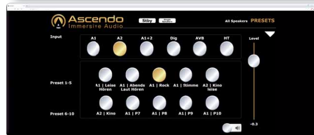
Auf den vielen Presets können verschiedene Hör szenarien abgespeichert und auf simplen Knopfdruck via Web browser abgerufen werden